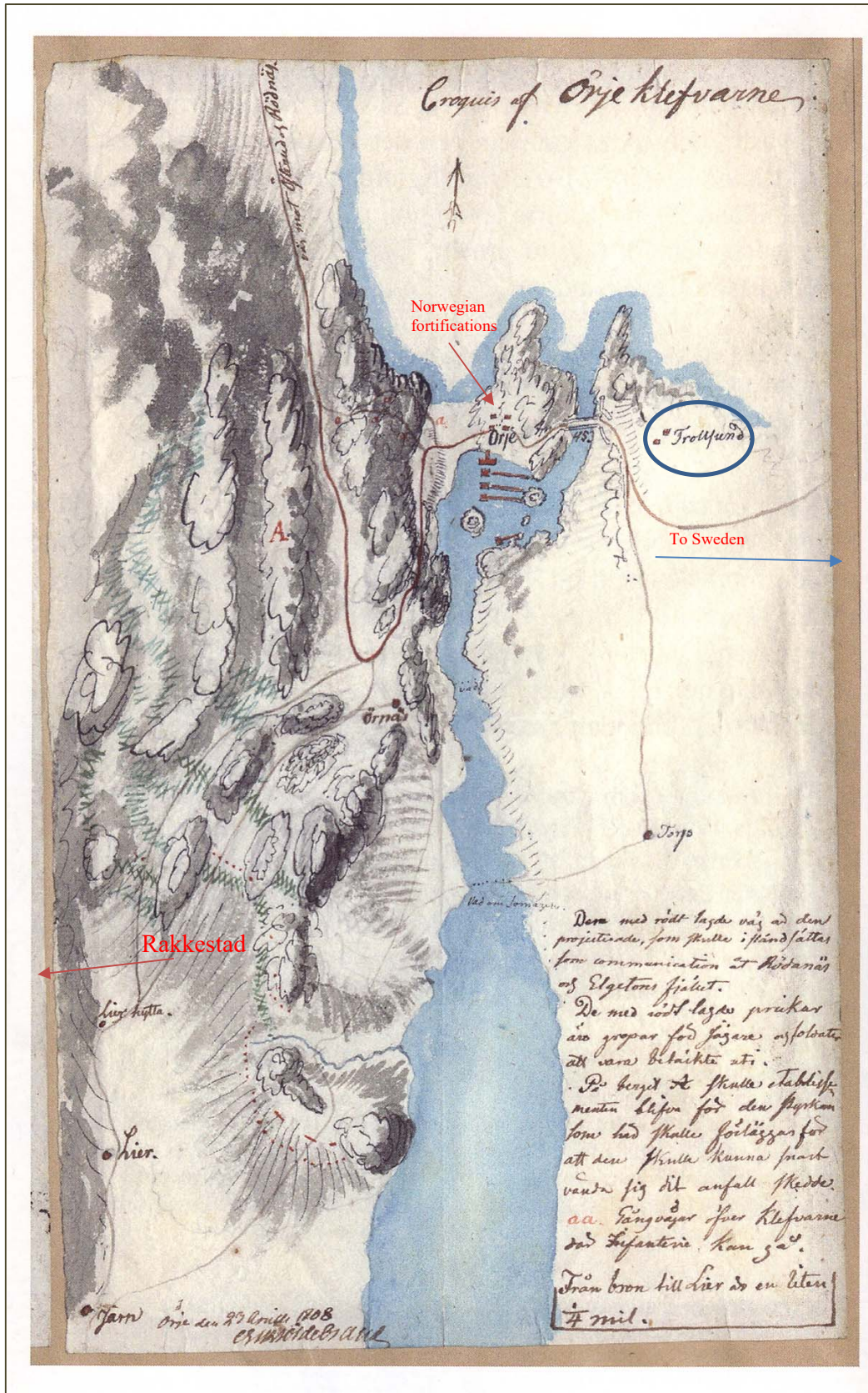
Swedish spy map, Trollesund farm, Ørje 23 April 1808. Found in Swedish archives.